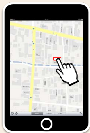
地図で建物位置を指定