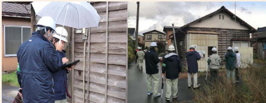
新潟市での訓練の様子 ※解体予定の市営住宅を利用