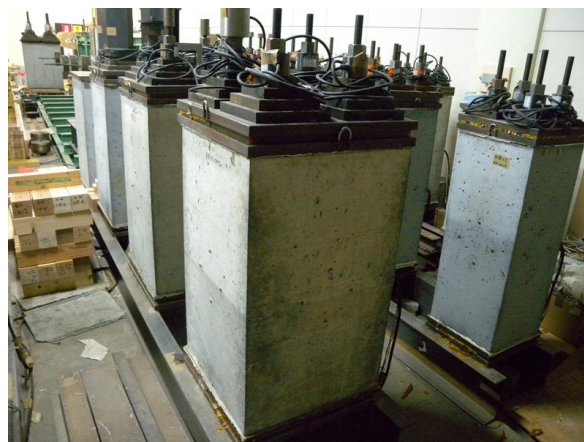
図—4 高強度コンクリート柱の圧縮クリープ試験の様子