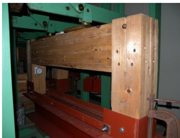
図—6 木造接合部のクリープ試験