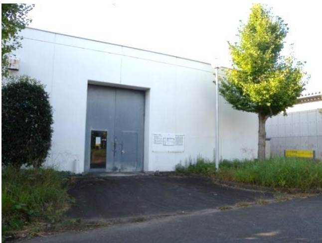
写真 図—1 クリープ実験棟の外観

クリープ実験棟は、このような建築部材の「クリープ変形」と「クリープ破壊」を測定するための実験施設です。実験棟内は一年中、温度 20℃、相対湿度 65%に管理されており、温湿度の変化の影響がない条件下で試験が行えるようになっています。クリープ変形の測定結果に基づいてクリープ増大係数を、クリープ破壊試験結果に基づいて、長期に生ずる力に対する許容応力度を決めることになっています。