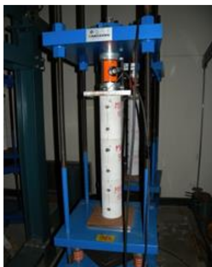
図—5 円筒型のコンクリート標本の圧縮クリープ試験の様子

材料クリープ試験室は、材料レベルでのクリープ試験やクリープ破壊試験を行うための試験室です。この試験室では、コンクリート標本の圧縮によるクリープ試験などを行っています。また、建築研究所がつくばに移転してからすぐに試験を開始した木造の接合部のクリープ試験も約30年間継続して行っています。