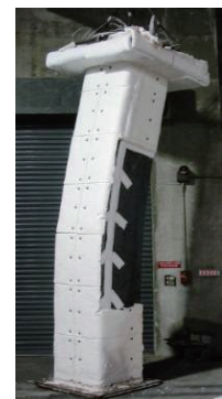
図1 鋼材温度の変化 写真1 変形した柱（耐火試験後）