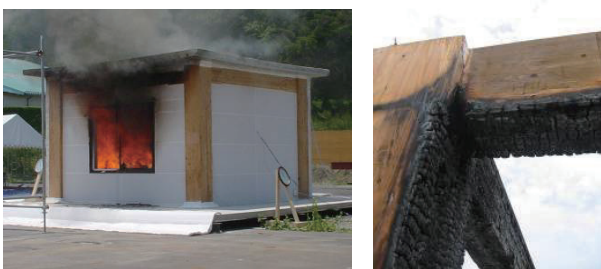
写真2 実大火災実験の様子と部材の燃え止まりの状況

この「燃え止まり部材」は耐火1時間の性能を有している柱や梁が開発され、耐火試験によりその性能が確かめられている。また、この「燃え止まり部材」の柱と梁を使用した4階建て事務所を設計し、その一部分を実際に建てて実大規模の火災実験も行っている。火災終了後の被害状況を調査した結果、柱や梁には部材毎による耐火試験と同様に燃え止まりが確認され、その耐火性能が確かめられた。（写真2）